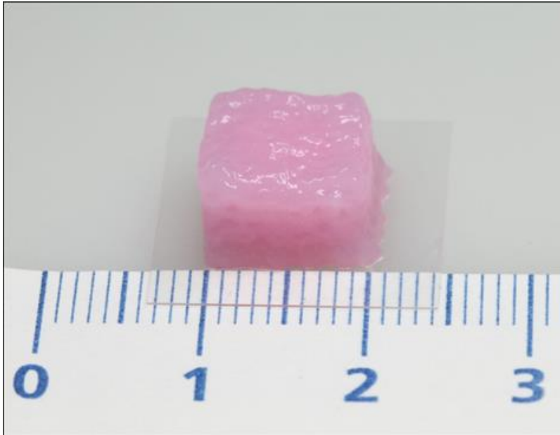
Bild 3: Umsetzung des Modells als gedruckter Würfel mit Blutgefäßen zur Herstellung von Knochengewebe